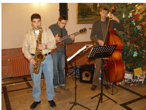
Foto: Für die musikalische Umrahmung der Ausstellungseröffnung sorgten Jugendliche der Leo Kestenberg Musikschule Tempelhof-Schöneberg

Die Ausstellung ist noch bis zum 10. Januar 2009 im Foyer des Rathauses Schöneberg bei freiem Eintritt zu sehen. Informationen über das Projekt gibt es unter www.tempelhoferforum.de