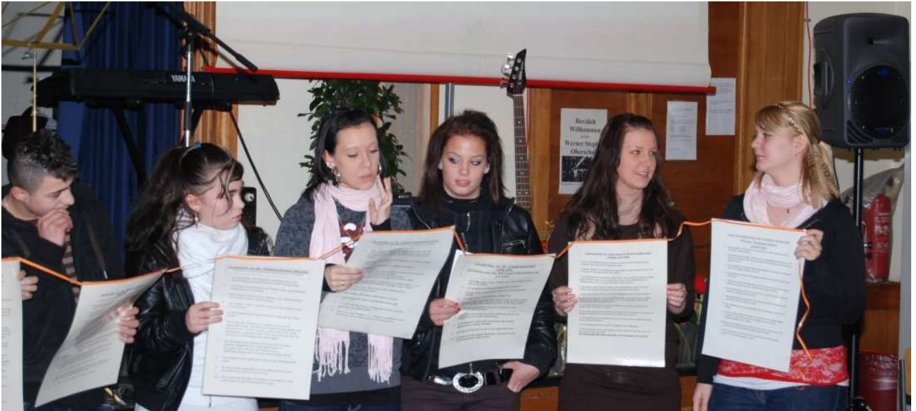
Foto: Die Schüler/innen stellen das Schulversprechen den Gästen der Veranstaltung in Auszügen vor.

zubinden, das Schulklima zu verbessern und einen Beitrag für ein demokratisches, friedliches und von Toleranz geprägtes Miteinander in der Schule zu leisten. Die WSO fing schon vor 20 Jahren damit an, mehrtägige Tagungen der Schülervertretung in einer Bildungsstätte durchzuführen. Neben der Auseinandersetzung mit dem Schulverfassungsgesetz, den Rechten und Pflichten einer Schülervertretung, wurde damals bereits damit begonnen, Trainingssituationen zur Konfliktbewältigung durchzuspielen.