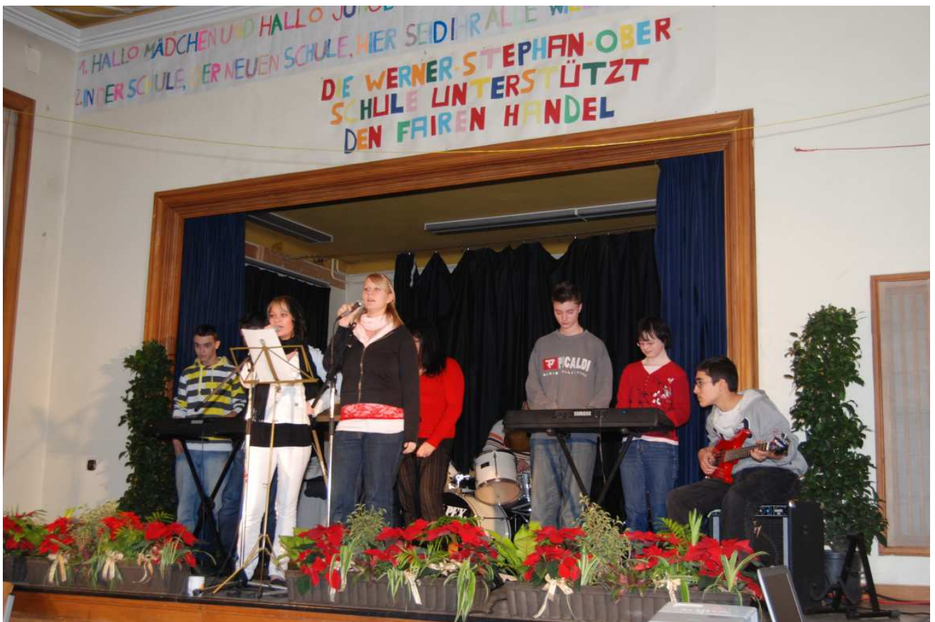
Foto: Schüler/innen der WSO singen und spielen IHREN Song.

Die Redner des Festaktes in der Aula der Schule anlässlich der Übergabe des Schildes am 4. Dezember 2008, bekundeten vor allem ihre Wertschätzung für die Schule. Das unterstrich auch Bildungsstadtrat Dieter Hapel , der sich vor allem über das Selbstbewusstsein der Schule freut und darüber, dass die Schülerinnen und Schüler ihre Schule so toll finden. Nach der Melodie von „The lion sleeps tonight“ hat die Klasse 7.3 2006 den WSO-Song getextet, den die Schüler/innen natürlich bei der Veranstaltung vortrugen. Anschließend konnten die Gäste die CD mit dem Song käuflich erwerben.