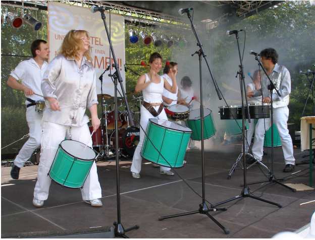
Die Sambagruppe der ufa-fabrik sorgte für Stimmung unter den Gästen.