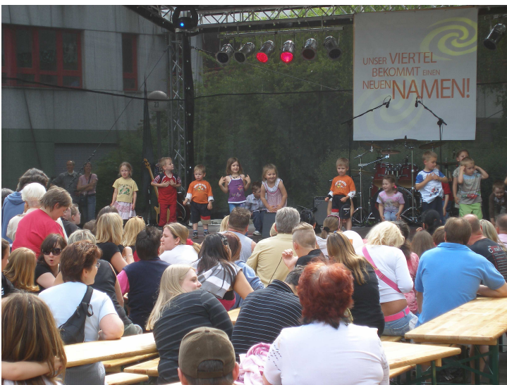
Eine Gruppe aus der Kita Nahariyastraße tanzte den Gästen etwas vor.